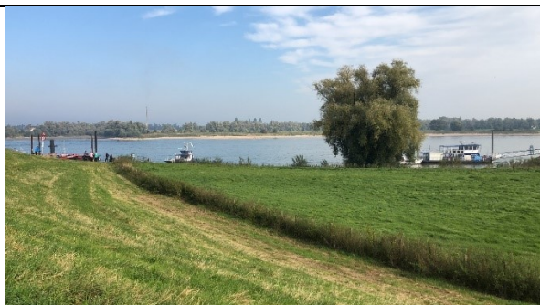
Pontje bij Pannerden

We rijden achter Groesbeek om over heuvelachtig terrein langs de grens naar Berg en Dal. Daarna via Leuth naar Millingen aan de Rijn. Dan gaat het over de dijk langs de Waal via Ooij naar Nijmegen, de brug over en meteen weer de dijk langs de Waal aan de andere kant. Bij Fort Pannerden botsen we tegen de Rijn en daar kunnen we de pont nemen.