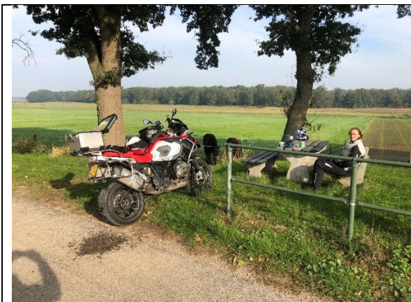
Koffie in t zonnetje